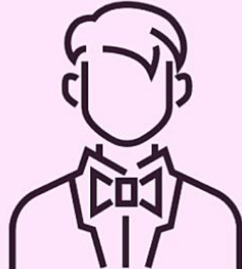
Estudiante de High School