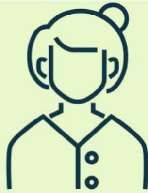
Alguien de la familia